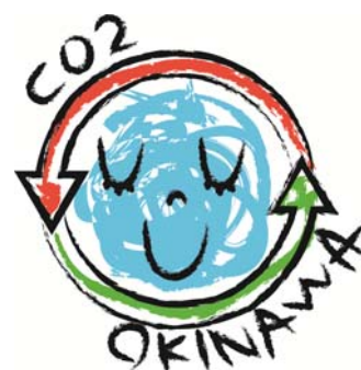
沖縄地域ロゴマーク